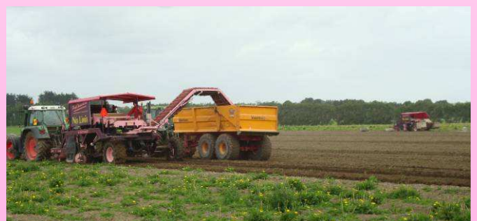
De wagenrooier in gebruik. Rechts staat de kistenrooier voor partijen die niet gespoeld worden.