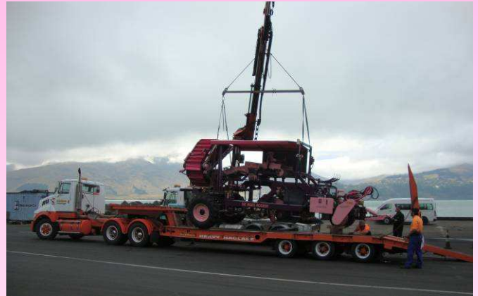
Laden op de dieplader in de haven van Christchurch in Nieuw Zeeland