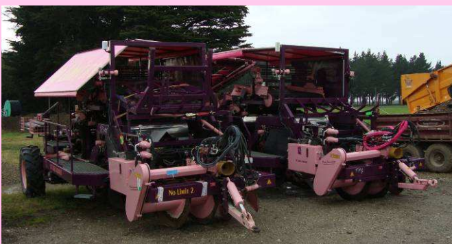
Beide Roze Rooiers staan klaar voor gebruik bij Triflor NZ in Edendale

In totaal zijn zij twee weken bij Triflor geweest. Binnenkort zal er op onze website een film te zien zijn van het rooien en het spoelen bij Triflor. Via deze weg willen wij nogmaals iedereen van No Limit NZ en Triflor NZ bedanken voor de plezierige samenwerking en het gezellig verblijf!