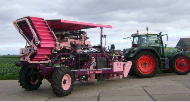
Vertrek uit Oostwoud